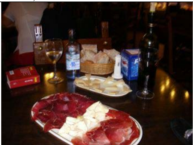
Første måltid i La Coruna efter Biscayen: Skinke, ost, brød og vin