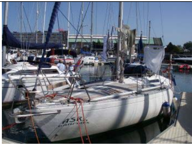
Asra i havn i Middelbourg i Holland. Der ventes på østenvind til sejladsen gennem den Engelske Kanal.