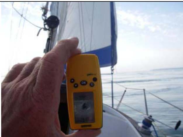
På vej mod Cherbourg. Sådan skulle det altid være: svag vind og rivende medstrøm. GPS'en viser 15,7 knob!