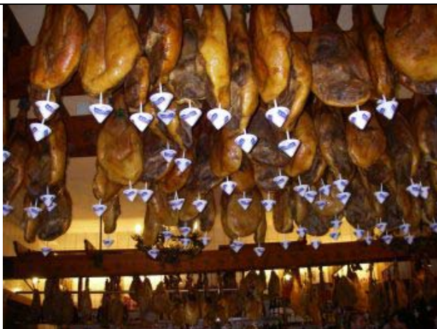
Og der var skinker nok at tage af der under loftet i restauranten i La Coruna!!