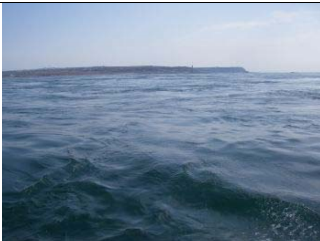
Fra Cherbourg til Falmouth. 8-9 knob strøm førte dog til Guernsey